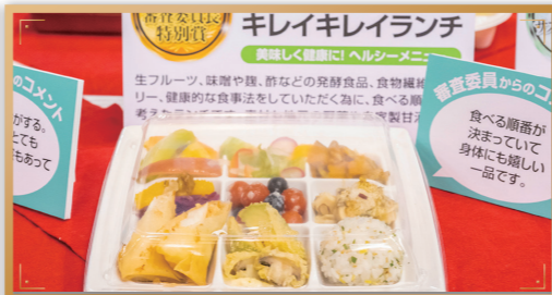
前回の様子(FOOD STYLE JAPAN 2025 <九州>内)