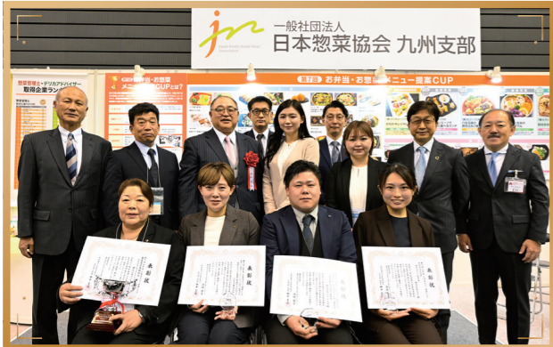
前回の様子(FOOD STYLE JAPAN 2025 <九州>内)

今年で記念すべき10回目を迎える商談展示会「FOOD STYLE JAPAN <九州>」の特別企画として、今回で第8回の開催となります。弁当・惣菜の専門家で構成された審査委員会が、選りすぐりのメニューの中から最優秀賞や特別賞などの賞を決定致します。また、業界関係者が多く来場される会場内で授賞式・受賞メニューの展示を行います。依然として続く物価高騰にも負けない、消費者が思わず買いたくなる様々なアイデアを募集致します。皆さまのご応募を心よりお待ちしております。